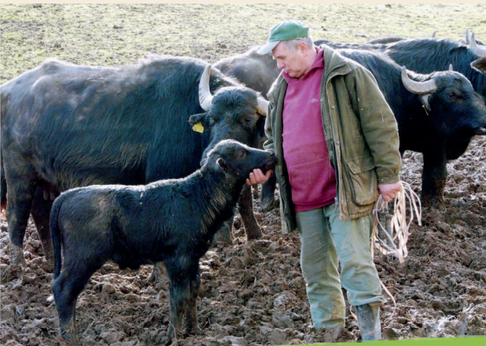
WASSERBÜFFEL AUS DEM HAFENLOHRTAL

Erlebnistage auf dem Lämmerhof! Einen Tag in die Welt des Schäfers eintauchen